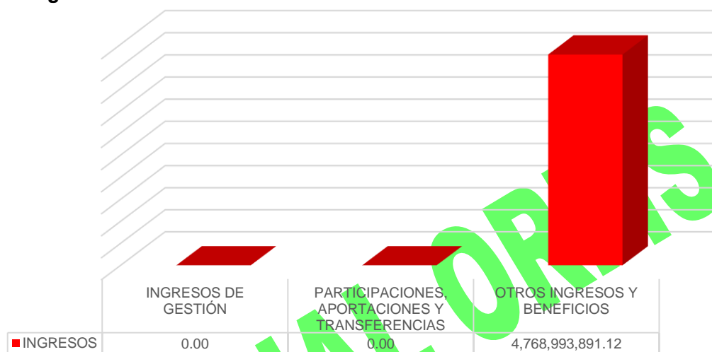
Gráfico 1. Ingresos